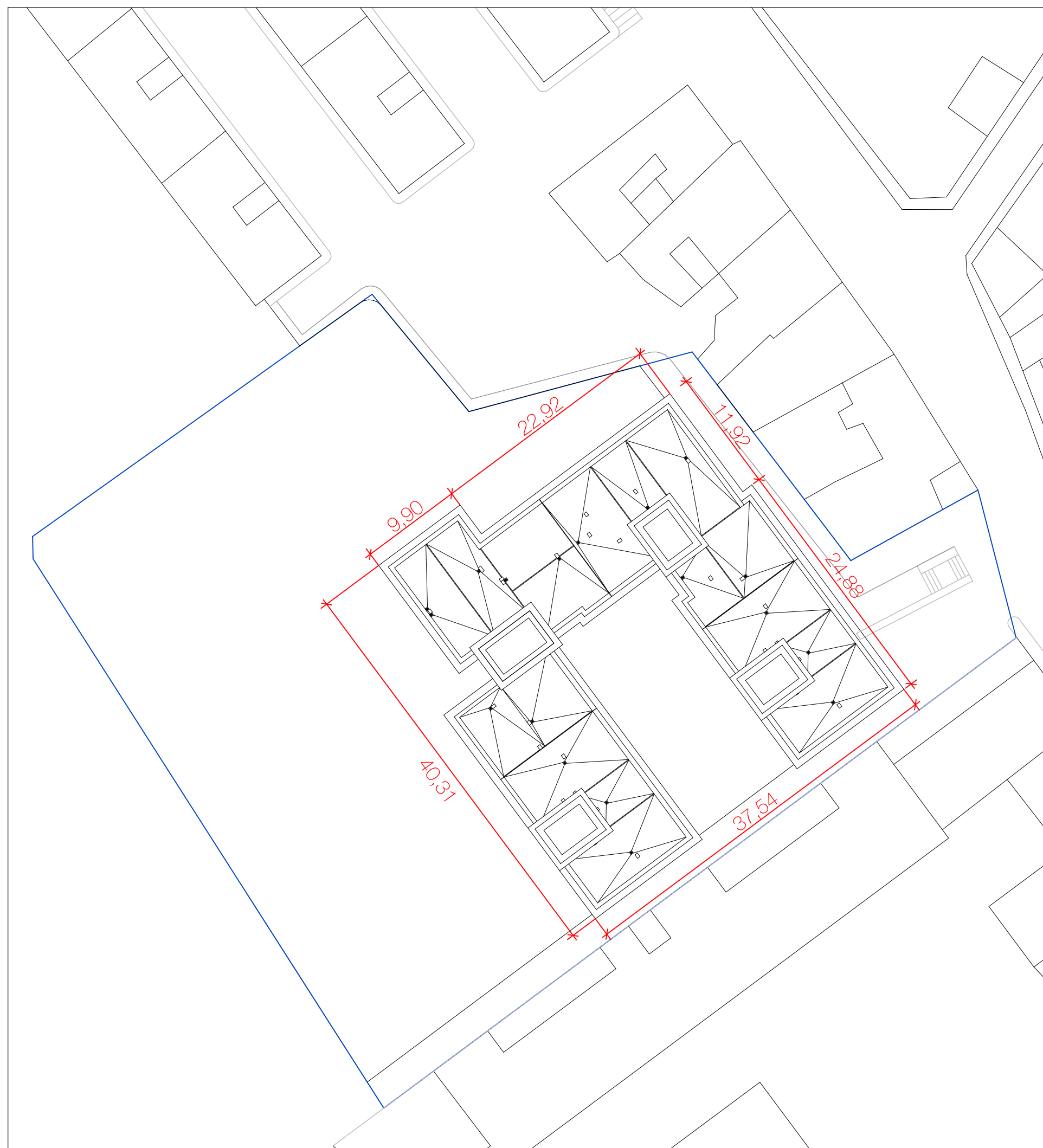
PLANO DE SITUACIÓN. ESC: 1/400